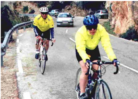
Bild: Radsporttraining auf Mallorca 2000

Im Laufe der letzten Jahre und besonders durch die Radsportfolge des Teams Telekom im Rahmen der Tour de France hat das Radfahren eine "Renaissance" erlebt. Nie zuvor benutzten so viele Menschen das Fahrrad, sei es Rennrad, Treckingrad oder Mountainbike, um ihre Freizeit aktiv zu gestalten. Über das Mountainbike sind breite Bevölkerungsschichten für das sportliche Radfahren gewonnen worden. Nicht zuletzt waren es auch die technischen Entwicklungen der letzten Jahre, die dem Erfolg des Radsports seinen Weg ebneten. Der Radsport erfreut sich immer größerer Beliebtheit.